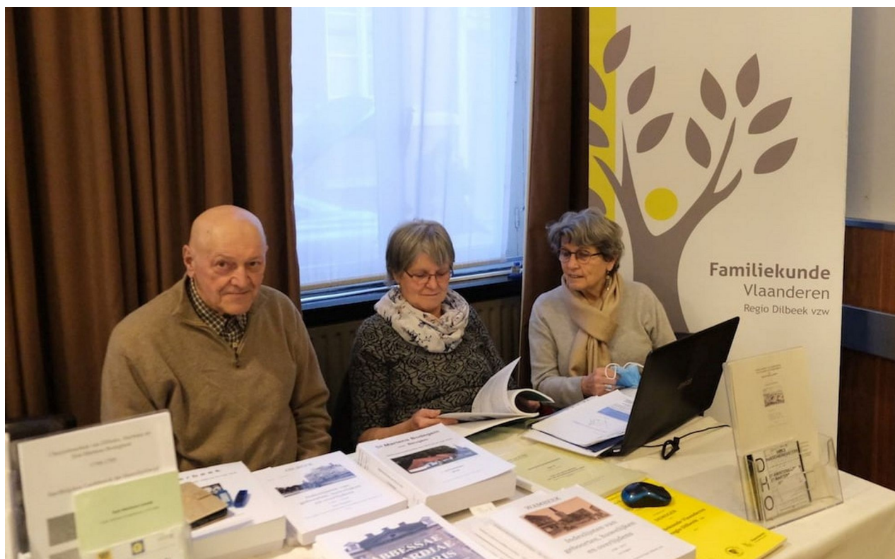
Onze stand op het Congres te Lier